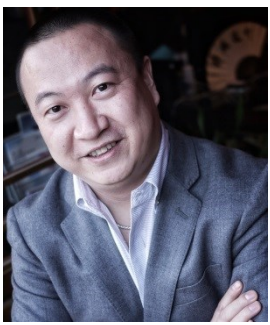
『長江図』 ワン・ユー (プロデューサー)