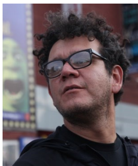
『朝日が昇るまで』 アレハンドロ・グスマン・ アルバレス監督