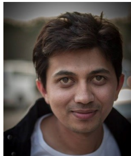
『ニュー・クラスメイト』 アジャイ・G・ライ (プロデューサー)