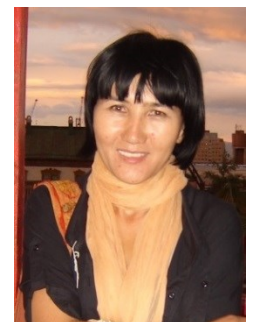
『アンダー・ヘヴン』 ダルミラ・チレプベル ゲノワ監督