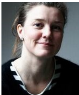
『幸せを追いかけて』 イングヴィル・スヴェー ー・フリック監督