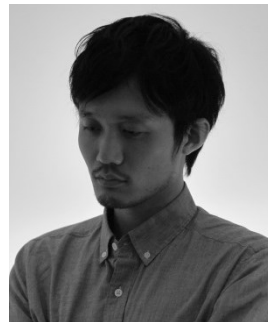
『アウト・オブ・マイ・ ハンド』 福永壮志監督